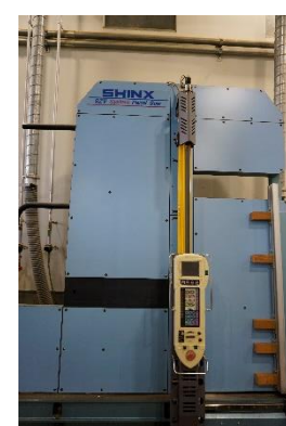
システムパネルソー (680円/時間)