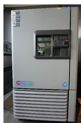
恒温恒湿器 (760円/時間)