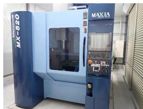
5軸マシニングセンタ (11,180円/時間)