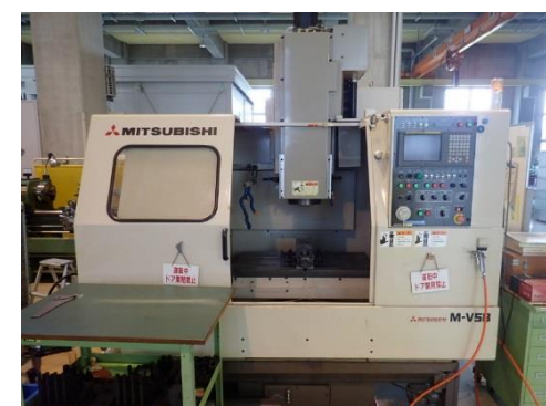
立形マシニングセンタ (450円/時間)

○その他の施設・設備は、福島県ハイテクプラザ 施設・設備データベースからご覧いただけます。