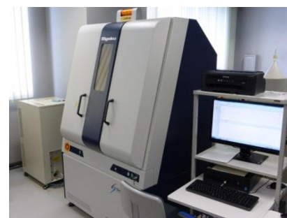
水平型エックス線回折装置 (6,460円/時間)