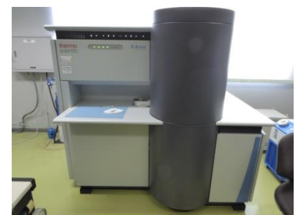
エックス線光電子分光装置 (14,580円/時間)

○その他の施設・設備は、福島県ハイテックプラザ 施設・設備データベースからご覧いただけます。