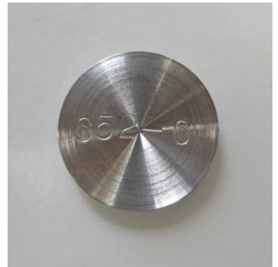
<試料> ステンレス (SUS 316) 材