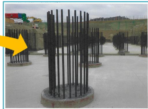
新沼部堰 現在の状況(基礎工)