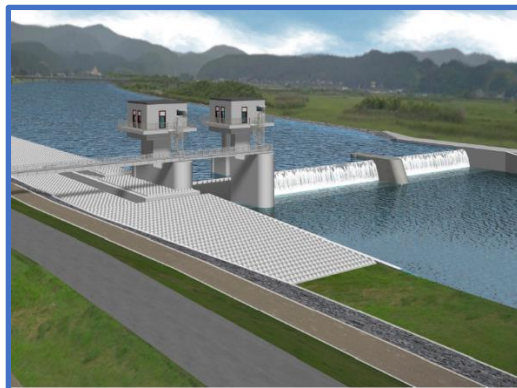
新沼部堰 完成予想図※