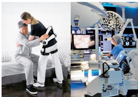
ロボットによる看護支援・手術支援