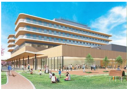
新病院イメージ図