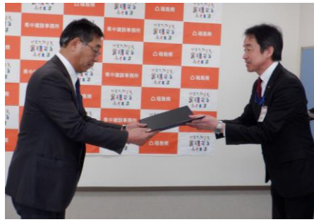
環境イノベーション(株)