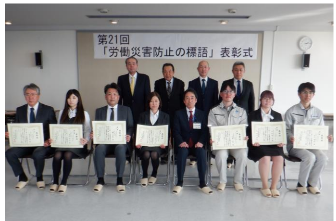
受賞者との記念撮影

最優秀作品に選ばれた標語は、令和7年度の労働災害防止の標語として労働災害の根絶を目指し、各工事現場や会社などに掲げられます。