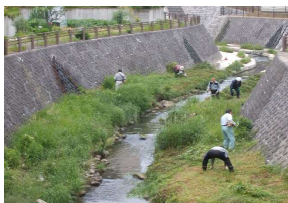
鯉川 根崎鯉川を守る会(二本松市)