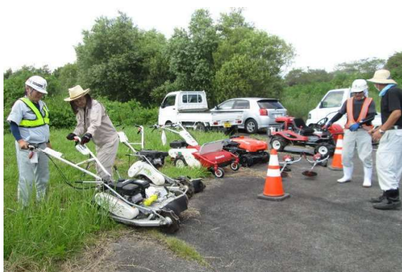
除草機械の貸し出し