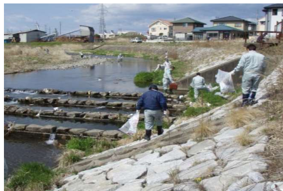
堀川 源流の里堀川河川愛護会(白河市)