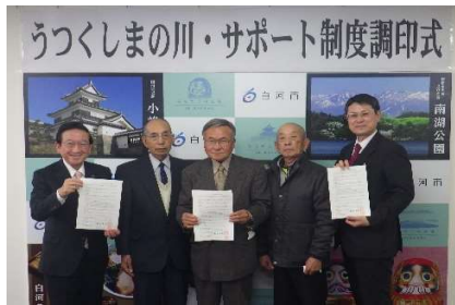
堀川 調印式 (白河市)