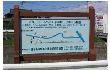
谷津田川 PR看板の設置 (白河市)