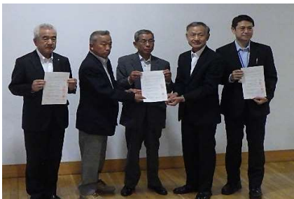
阿武隈川 調印式 (中島村)