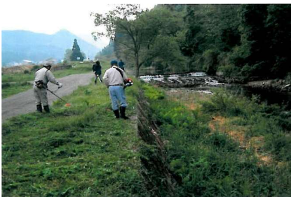
野尻川 昭和小学校(昭和村)