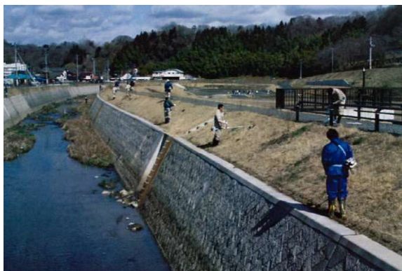
湯本川 湯本川を愛する市民ネットワーク(いわき市)