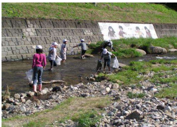
石田川 石田小学校(伊達市)