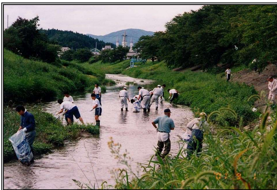
二級河川夏井川水系 右支夏井川 小野町「夏井川友の会」