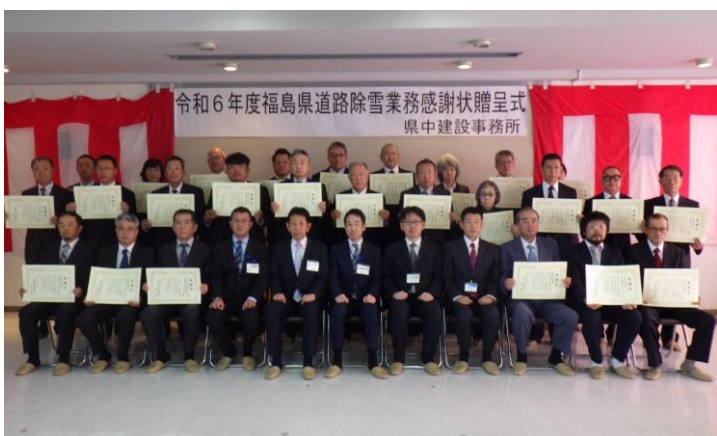
除雪企業(三春土木、石川土木、須賀川土木)の集合写真