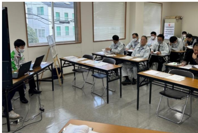
福島二チレキ(株)の説明

県中建設事務所では、今後も様々なテーマで研修会を開催し、技術力向上を図ってまいります。