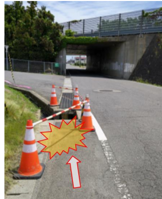
グレーチング盗難箇所

道路上で不審な行為や盗難現場を見かけた方は、110番もしくは建設事務所または土木事務所へご連絡をお願いします。