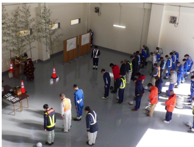
安全祈願祭の様子

これから、降雪や路面凍結が発生する時期となります。降雪・圧雪時には、十分な車間距離をとり、ゆとりをもって走行するようお願いします。