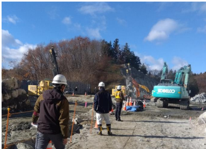
パトロールの様子(須賀川、石川方部)