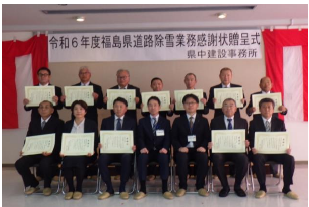
除雪従事者の集合写真