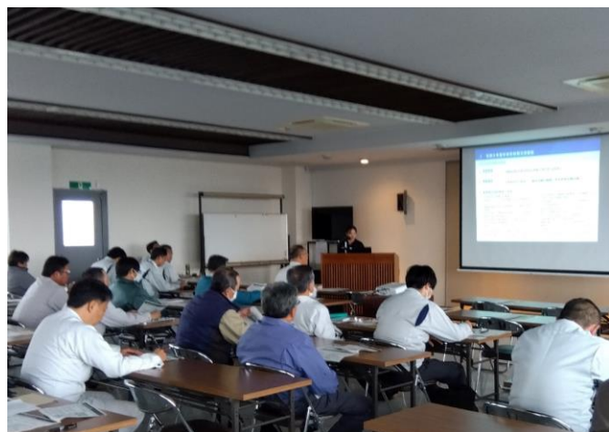
講習会の様子(郡山、田村方部)

また、安全パトロール後には、労働安全に関する講習会を実施し、安全管理に対する意識向上を促し労働者への注意喚起を図りました。