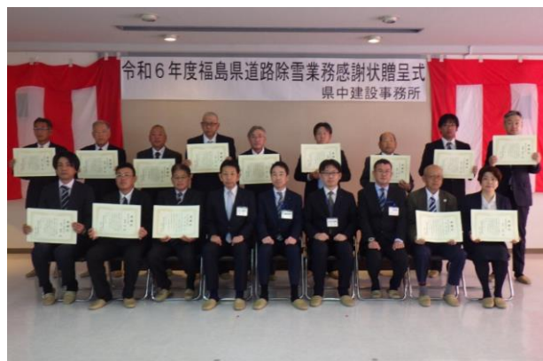
除雪企業(県中建設)と除雪団体の集合写真

令和6年10月24日(木)、郡山建設会館で県中建設・三春土木・須賀川土木・石川土木管内において道路除雪に尽力されてきた企業39社、除雪従事者12名、除雪団体2団体の功績をたたえ、県中建設事務所長から受賞者一人ひとりに感謝状を贈呈しました。