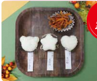
※お米がなくなり次第終了となります。※写真はイメージです。

はじめに食べたプチむすびは、果たしてどのお米なのか!? 答えは「天のつぶ」、「五百川」、「コシヒカリ」のどれかに! 見事利き当てた方には素敵なプレゼントを差し上げます!