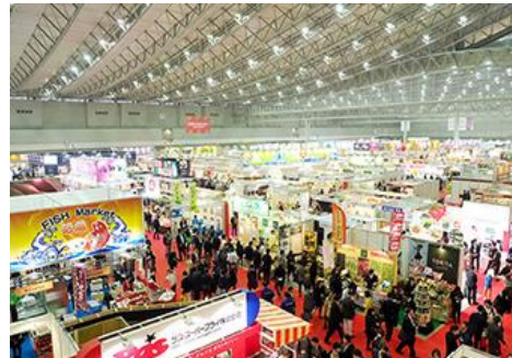
※FOODEX JAPAN 2017 参考写真