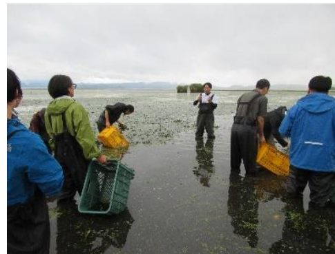
活動支援研修の様子