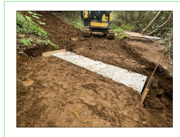
排水構造物工 施工写真 工事進捗85.0%