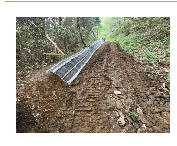
法面保護・土砂流出防止工 施工写真 工事進捗54.1%(施工全長576.9mの内312.3m施工完了)