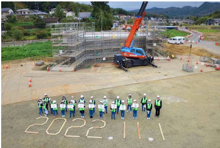
上遠野小学校現場見学会 ドローンによる記念撮影 2022. 11. 1

一方、平工業高校や福島高専など土木関係を学ぶ学生を対象に将来の担い手への現場見学も行っています。