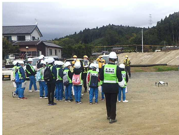
現場管理用ドローンの見学