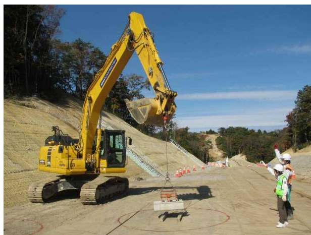
重機への指示出し体験