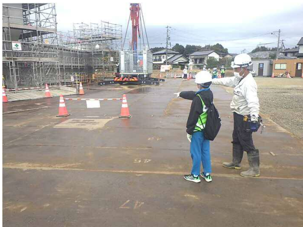
クレーンへの指示出し体験