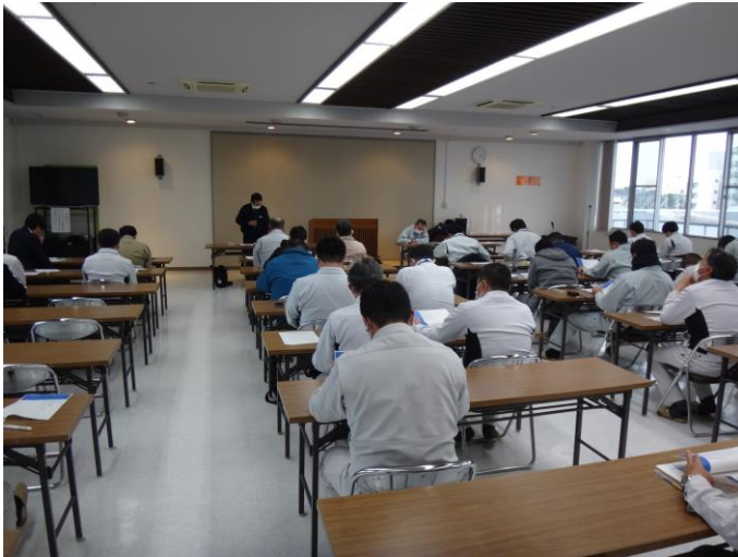
労働安全講習会の状況〈郡山方部〉

パトロールでは、県中建設事務所管内の工事現場における事故防止の啓発を行うとともに、安全管理に対する意識向上を促し労働者への注意喚起を図りました。