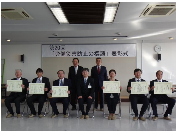
受賞者との記念撮影

最優秀作品に選ばれた標語は、令和6年度の労働災害防止の標語として労働災害の根絶を目指し、各工事現場や会社などに掲げられます。