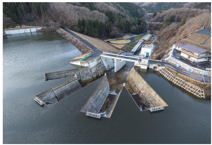
ダム全景（最高水位到達時） 令和6年1月1日撮影