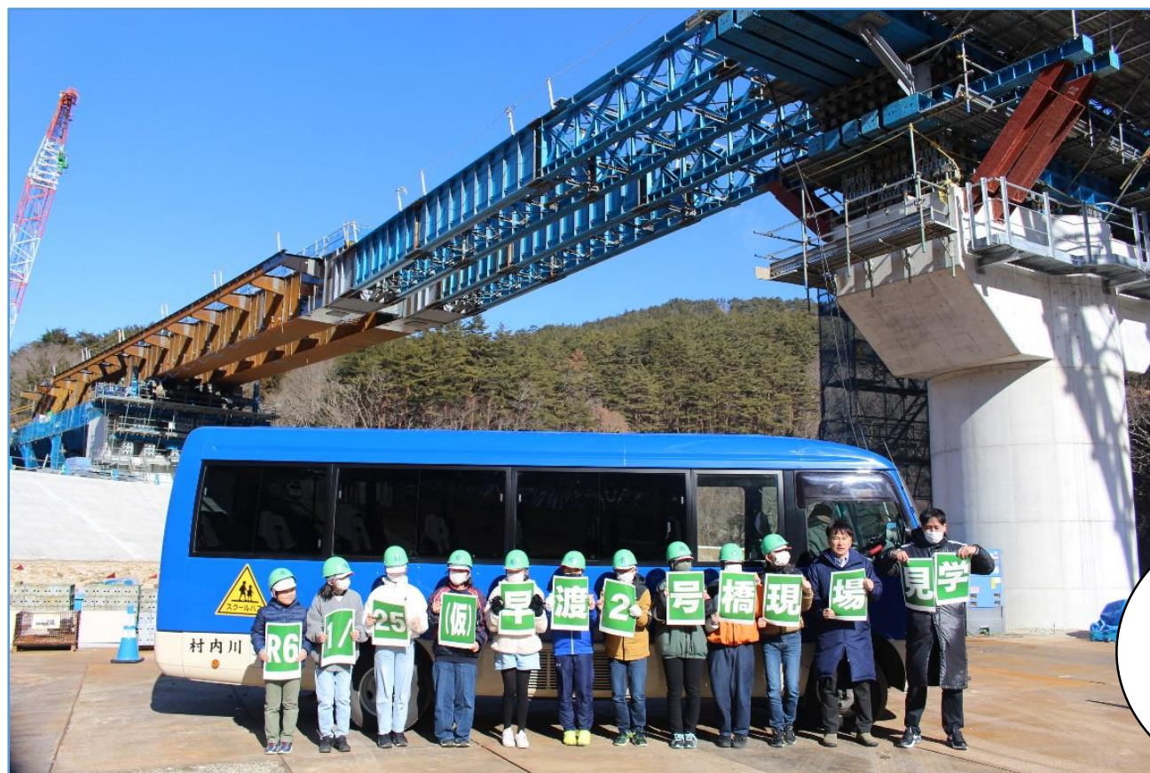
↑橋梁工事のスケールの大きさを体感!!