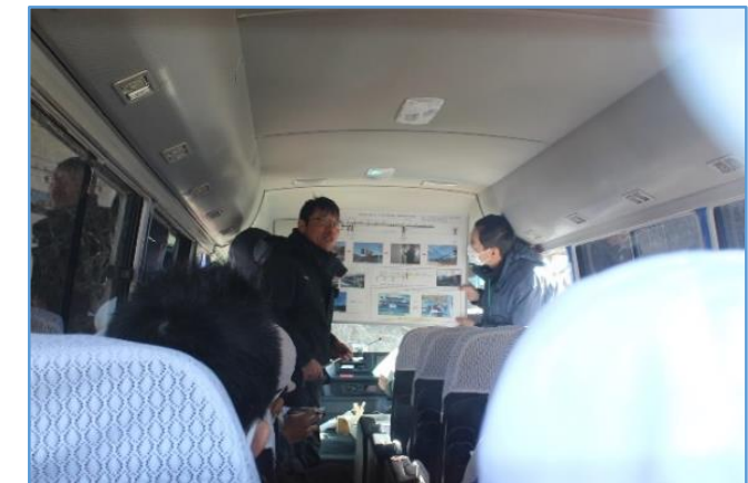
↑あいにくの強風でバスの中での説明に…。