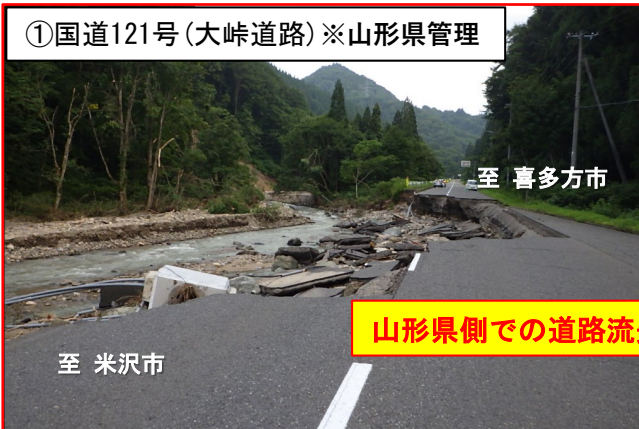
山形県側での道路流失により全面通行止め