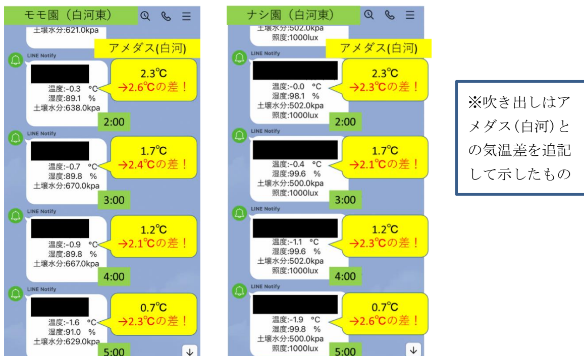
図1 園地の温度と気象情報の違い（いずれも4月4日）