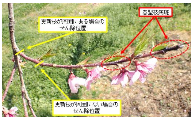
図3 春型枝病斑のせん除位置