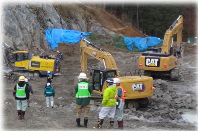
点検状況〈須賀川、石川方部〉

12月2日（金）と12月5日（月）に県中建設事務所、管内労働基準監督署及び管内建設業協会の3者合同により「第2回安全パトロール」を実施しました。 県中建設事務所管内の工事現場における事故防止の啓発を行うとともに、安全管理に対する意識向上を促し労働者への注意喚起を図りました。