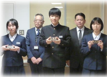
馬尾橋、紫陽花橋、江花川 須賀川市立長沼中学校 中学生3名