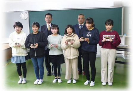
馬尾橋、やまゆり橋、紫陽花橋、江花川 須賀川市立長沼小学校 小学生6名