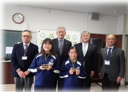
こまち大橋、大倉橋 小野町立小野小学校 小学生2名