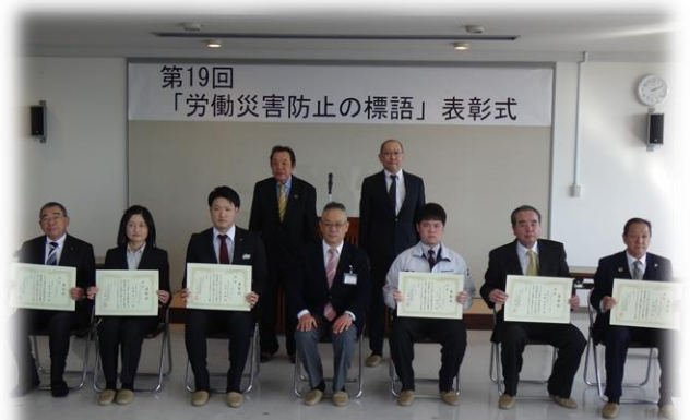
会場 郡山建設会館

最優秀作品に選ばれた標語については、次年度の労働災害防止の標語として、各工事現場や会社などに掲げ、労働災害の根絶を目指します。