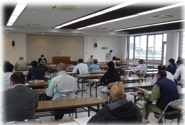
労働安全講習会の状況〈郡山方部〉