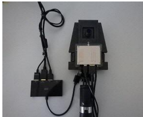
<ミリ波レーダーおよび単眼カメラ>