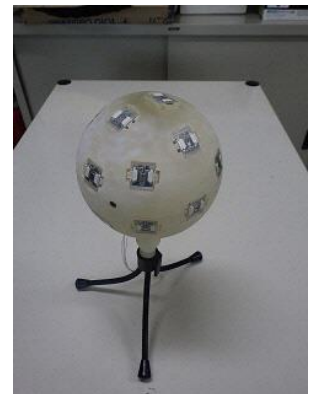
<マイクロフォンアレー>

本実証では、実測したデータをもとに、さまざまな通信環境を模擬できる 5G エミュレーターを用います。福島県ハイテクプラザの拠点で、繁華街の混雑時や山間部の電波が届きづらいエリアなどのさまざまな場所・条件の通信環境を再現し、5G を用いたロボット遠隔制御の定量的な評価が可能となります。