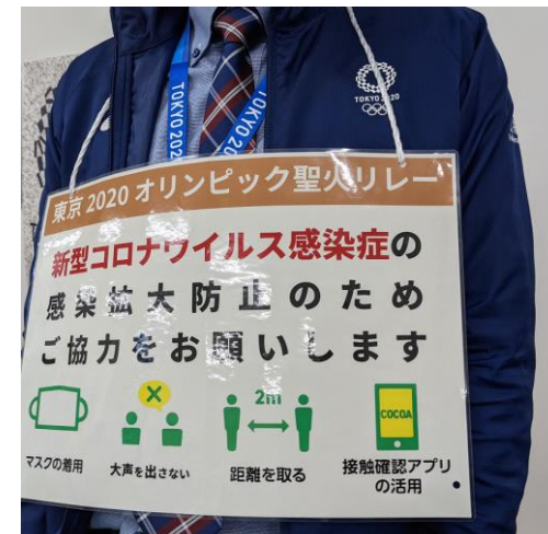
肩掛けプラカード