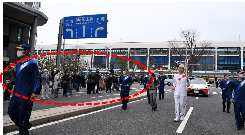
臨時的に車道を開放 (郡山市)