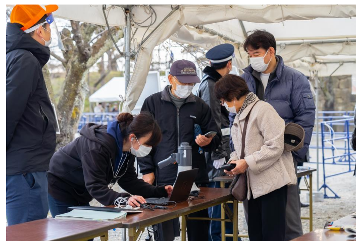
QRコードで予約を確認