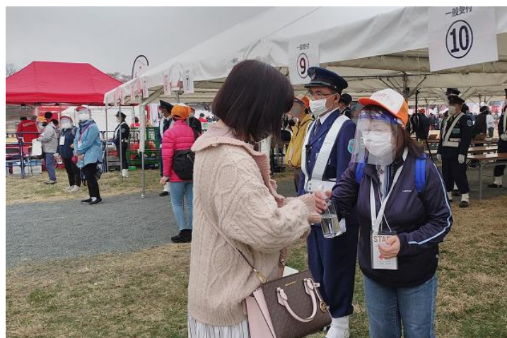
観客の手指消毒をするボランティア