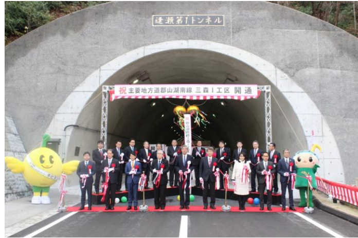
テープカットの様子

「三森工区」が完成したことから11月28日(日)午前10時より開通式が執り行われ、井出副知事が式辞を述べ品川市長ら関係者がテープカットをして完成を祝いました。