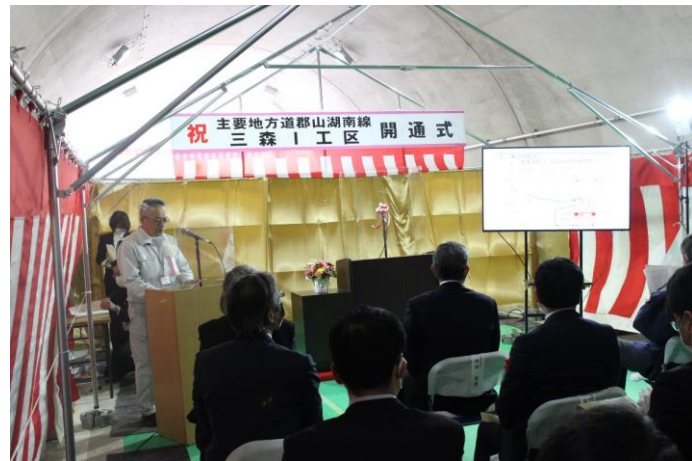
事業経過報告の様子