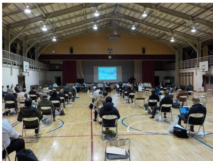
合同説明会の様子