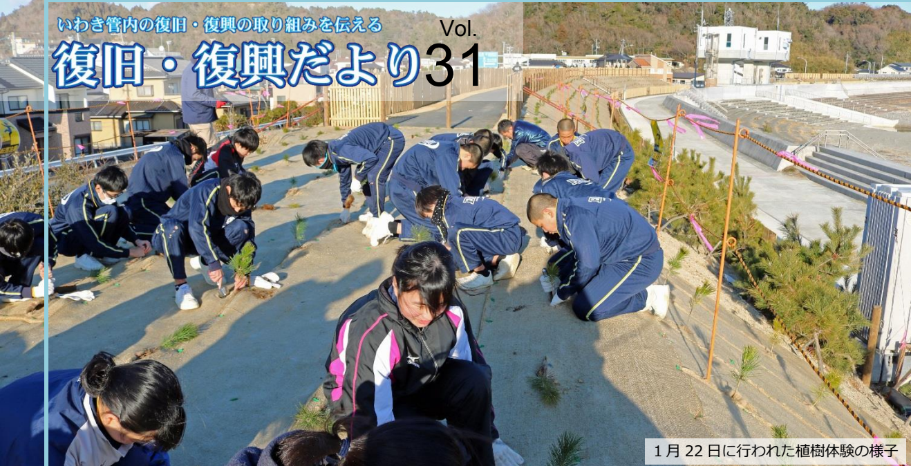
1月22日に行われた植樹体験の様子