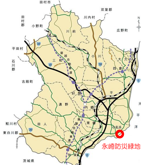
— 永崎防災緑地の位置 —