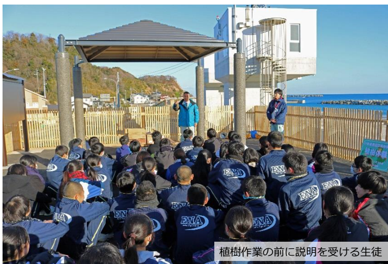
植樹作業の前に説明を受ける生徒

いわき市立江名中学校 永崎海岸防災緑地植樹体験に参加して、クロマツの苗を植えました。今は小さな苗木ですが、僕たちが大人になる頃には立派な林になり、万が一また津波が押し寄せてくるようなことがあったら、災害からこの美しい永崎の町を守ってくれたいことを願っています。