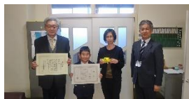
近津小学校【佳作・学校賞】