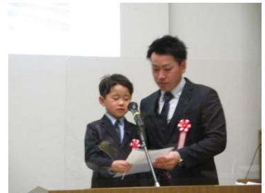
表彰式及びワークショップの様子〔令和3年12月11日（土）福島テルサ〕