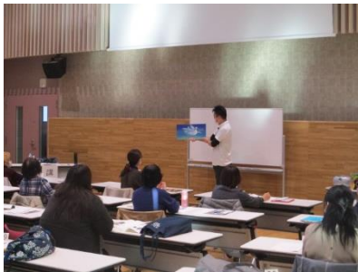
絵本よみきかせのコツ講座

参加者からは、「ほめていく大切さを学びました。」「読み手や聞き手のそれぞれの気持ちが経験でき、たくさん収穫がありました。」「同じような悩みを抱えていることが分かり、みなさんと話ができよかったです。」などの感想が聞かれました。