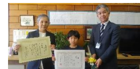
高野小学校【佳作・学校賞】