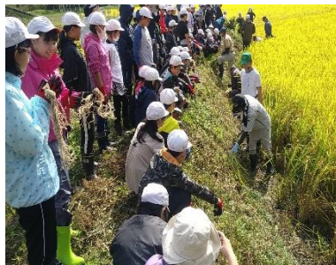
10月 棚倉小学校【稲作体験・稲刈り】