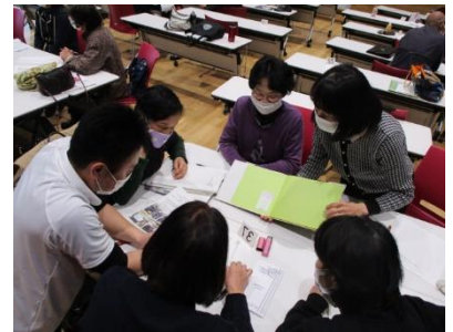
参加者による情報交換