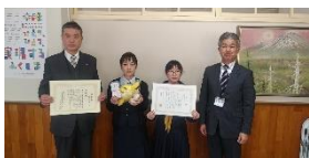
棚倉中学校【優秀賞・学校賞】