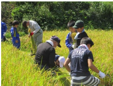
9月 塙小学校【稲作体験・稲刈り】

過疎・中山間地域連携事業の一環として、地域の人材を活用した体験事業を通して、地域への愛着を育て、次代を担う人材の育成を目的に、東白川の小学校8校で取り組んでいます。