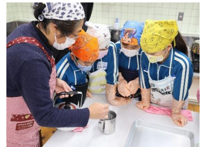
11月 笹原小学校【こんにゃく作り体験】