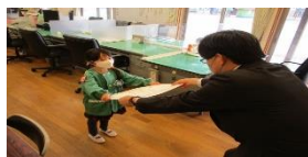
中島幼稚園【佳作・学校賞】