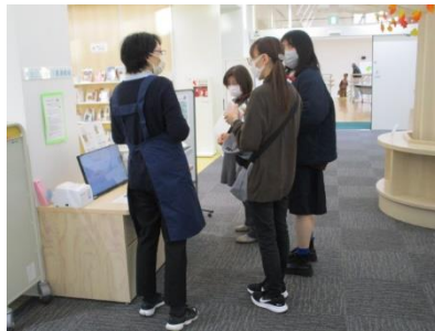
矢吹町図書館見学