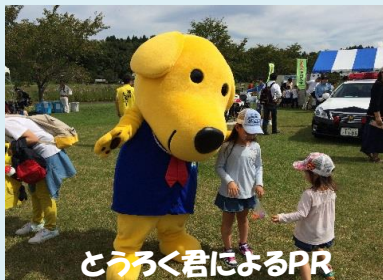
たろうく君によるPR