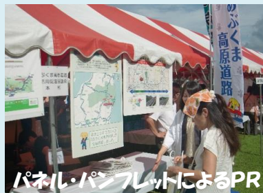
パネル・パンフレットによるPR

9月25日(日)、栃木県那須町余笹川ふれあい公園センターで開催された「第14回那須九尾まつり」でパネル展示やパンフレットの配布を行い、あぶくま高原道路や沿線地域の特産品のPRを「あぶくま高原道路利活用促進協議会」の方々と行ってきました。