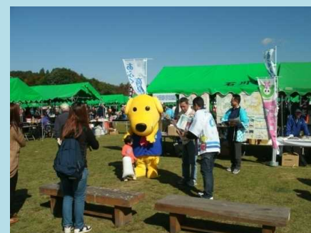
とうろく君によるPR