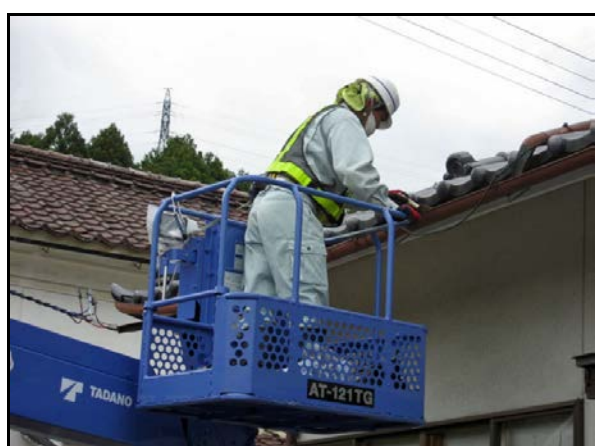
雨樋(横樋の堆積物の除去・拭き取り)の除染作業