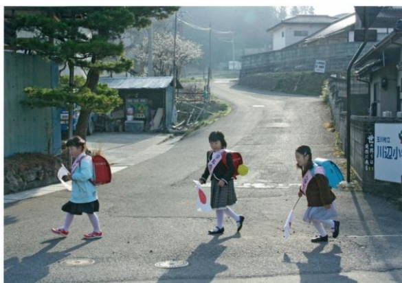
第2回公益財団法人福島県区画整理協会賞『日の丸入学』

公益財団法人福島県区画整理協会の主催により、第3回だいすきな街かど写真コンテストが開催されます。応募資格は、プロフェッショナル・アマチュア、年齢、性別問わず、福島県民及び福島県にお住まいの方です。応募テーマは、「だいすきな ふくしまの街かど」です。心に残る、ふるさとふくしまの街かどの風景を撮影してご応募ください。