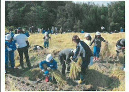
児童による稲刈りの様子

田んぼの学校を5月に開校してから、約5か月がたち、お米を作るには多くの手間が掛かることを理解してくれたと思います。