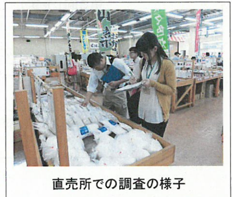
直売所での調査の様子