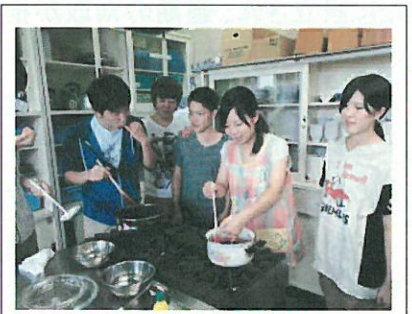
ブルーベリージャムづくり

短期間でしたが、学生は、農業の厳しさや楽しさ、矢祭町の人々の暖かさに触れ、また来たいと話してくれました。