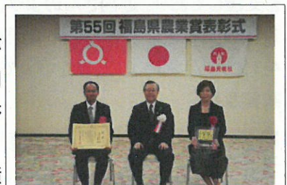
知事との記念撮影

これらの功績が高く評価され、今回の受賞の栄に浴されました。今後は、更なる研鑽 けんさん を積み、栽培技術と収益性を高め、他産