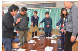
カップルが愛を深め合うコースにしたいと話合う皆さん。誰のキャッチコピーがいいか「セーの!」で指さしたところ。