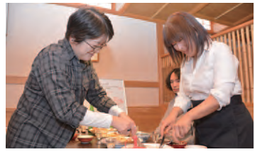
1月のオープンに向け、地元食材を生かしたメニューを、仲間と一緒に考案

さんが増え、会津の街全体がパワーアップし、10年、20年後には、会津を世界的なグルメ都市にすること「これが私の夢です。」