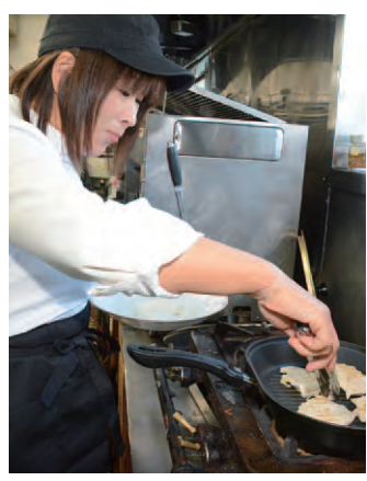
ただ今メニューの試作中

最近では、遠方から会津に来て酒蔵をめぐる人が増えてきていると感じています。私は、そんな皆さんをお出迎えする窓口になって、酒と食を通して会津の魅力を紹介していきたいと思いました。そこで今回、県の支援事業に応募し、「地酒案内所」を立ち上げることにしました。