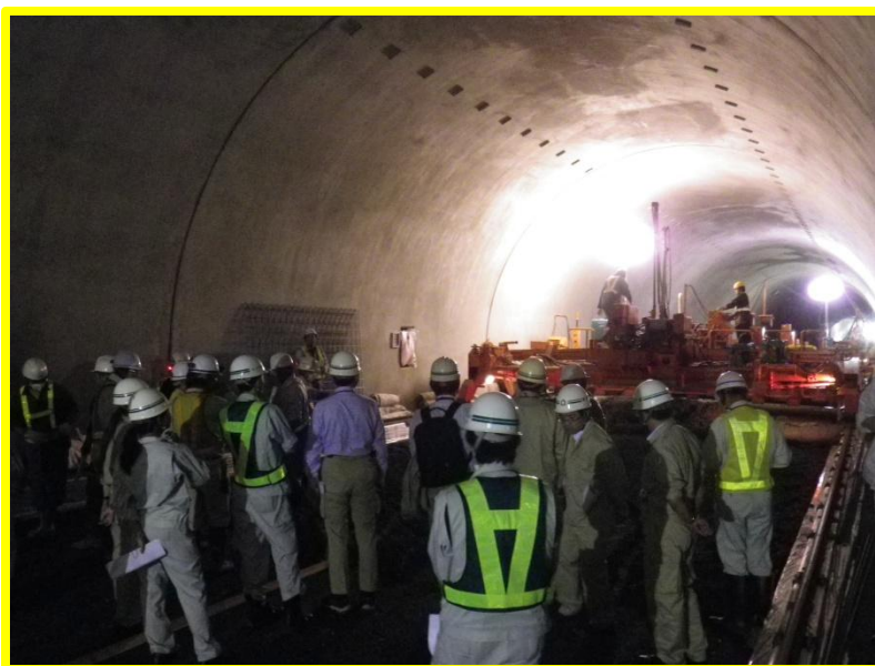
研修状況（トンネル内）