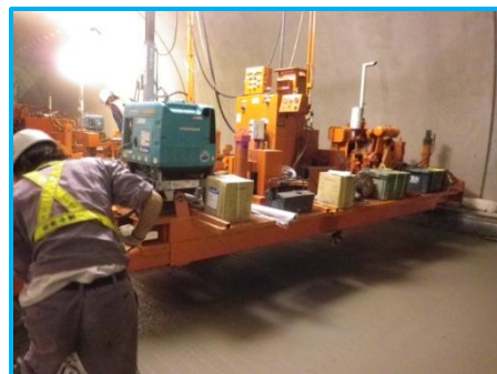
コンクリートレベラーによる 上層コンクリート仕上げ状況