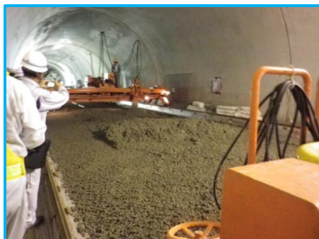
コンクリートスプレッターによる 上層コンクリート敷均し状況