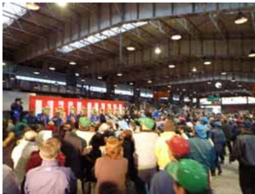
（いわき市中央卸売市場の初市式の様子）

いわき市中央卸売市場は、東日本大震災からの一日も早い復旧・復興を後押しするため、食料品等の安定供給の役割が期待されています。