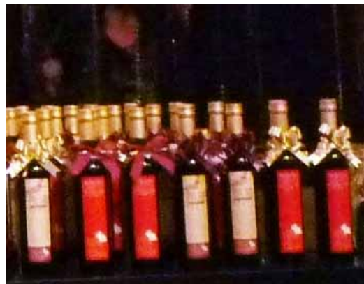
(希望(ゆめ)ワイン『レ・ジュー・デ・ラパン』)