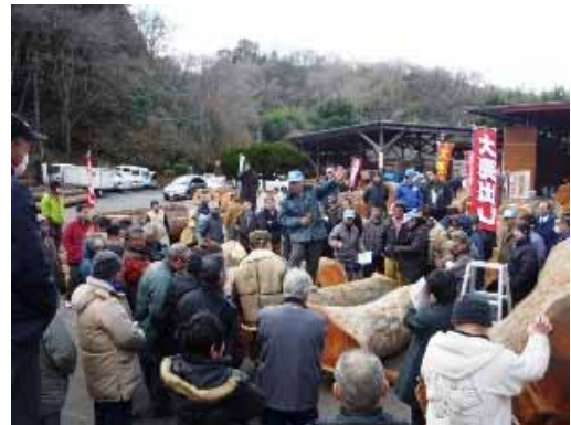
（平木材市場の初市の様子）

当日は天候にも恵まれ、活気に満ちた競り売りにより、スギ中目材が1 \text{m}^3 当たり1万3000円台の値を付けたほか、ケヤキの優良木も高値で取引されるなど、幸先の良い初市となりました。