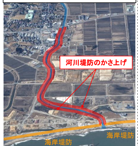
海岸に接続する河川堤防の整備イメージ