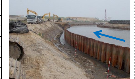
濁川の堤防整備状況(H26.8月末)