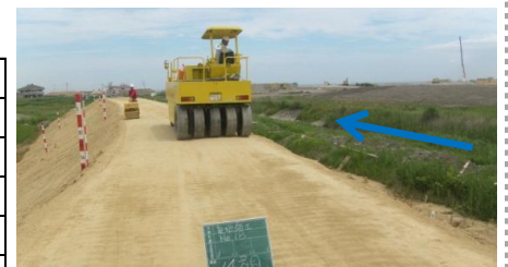
砂子田川の堤防整備状況(H26.8月末)