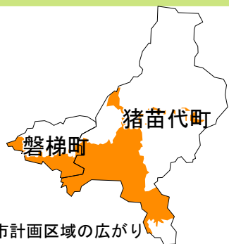
図 都市計画区域の広がり