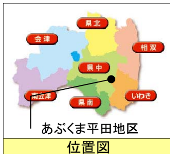
あぶくま平田地区 位置図