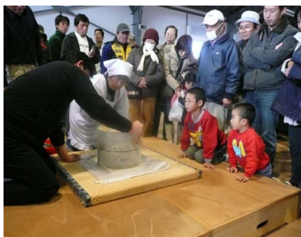
いなかみち物産展

・あぶくまロマンチック街道構想推進協議会関係町村（飯舘村、浪江町、葛尾村、田村市、川内村）の特産品販売をしました。