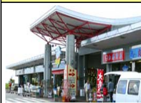
いわき・らら・ミュウ