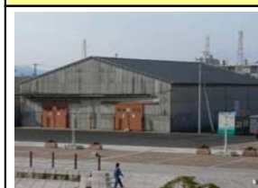
小名浜さんかく倉庫