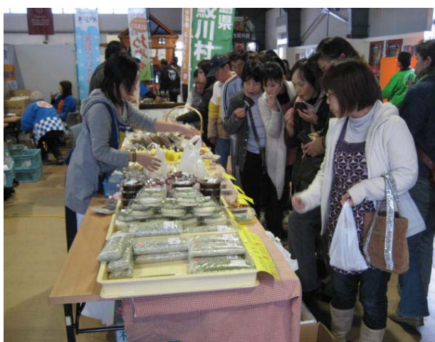
まるごとしらかわ