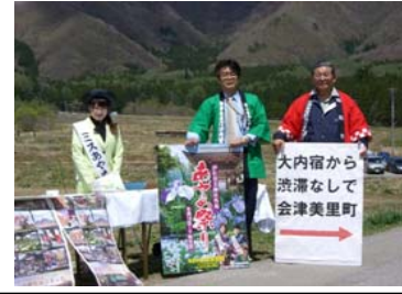
会津美里町との交流連携