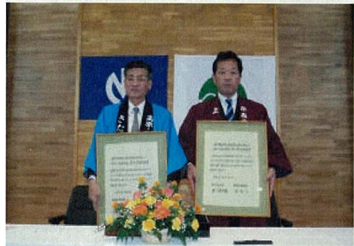
スポーツ合宿誘致の協定書を持つ横戸上市市長（右）と高橋北塩原村長