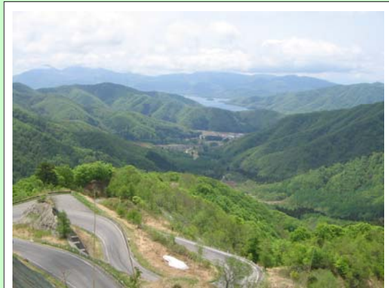
視点場からの眺望