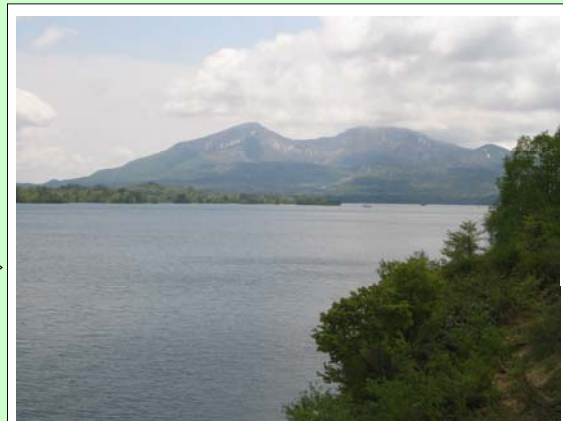
視点場からの眺望