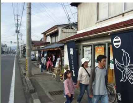
おたづき蔵通りへ のれん掲示