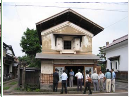
まちづくり寄り合い所