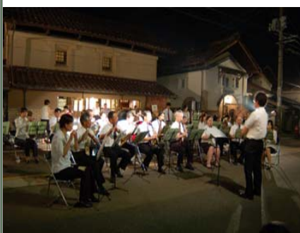
蔵してる通りフェスティバル