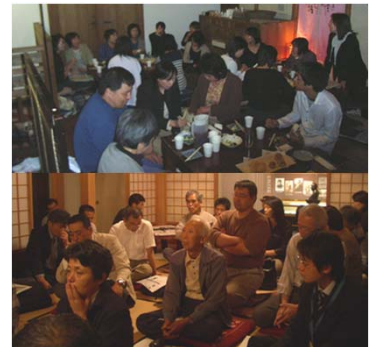
まちづくり語り合い