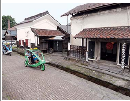
ベロタクシーの運行