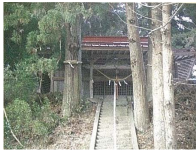
戦国期にさかのぼる古くからの歴史