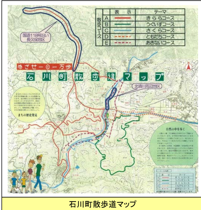
石川町散歩道マップ