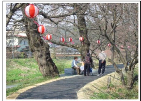
ベンチで楽しく談笑