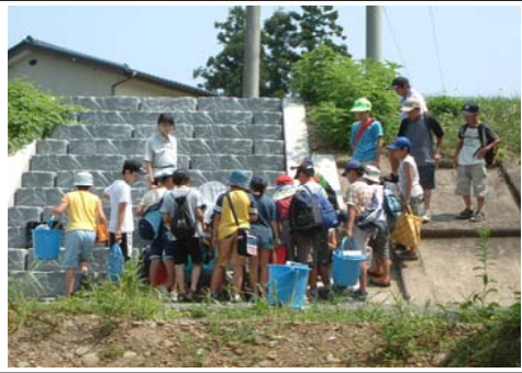
吾妻学習センター主催のわんぱくカレッジ