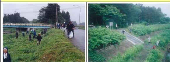
天戸川を守る人たち