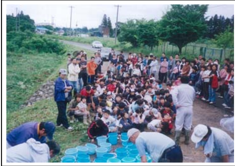
庭坂小学校生徒による稚魚放流