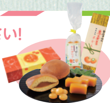
●赤カボチャようかん ●赤カボチャ飴 ●赤カボチャどら焼き

抽選で30名様に、 赤カボチャスイーツセットを プレゼント!ご応募をお待ちしております。