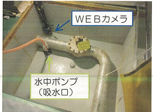
WEBカメラと水中ポンプ（吸込口）の設置状況