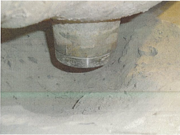
当該弁（F042B）下部の床面はつり状況