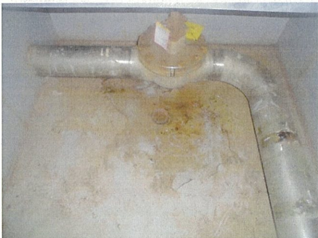
使用済燃料プール冷却浄化系 当該弁 (F042B)漏えい状況