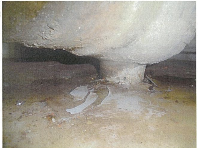
当該弁 (F042B)下部の状況