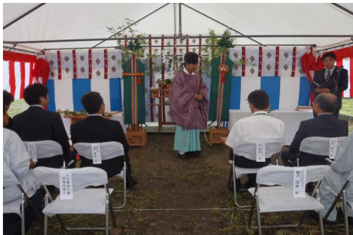
【安全祈願祭の様子】

災害復興公営住宅の着工に先立ち、平成26年7月9日に会津若松市門田町において年貢町団地2・3号棟の安全祈願祭が執り行われました。