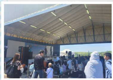
ウルトラヒーローショー

5月17日（日）、2026春の福島空港まつりが開催されました。当日は天気も良く、親子連れなど約8,000人の方々が来場し、会場は盛り上がりました。ステージでは、ウルトラヒーローショーや、マジカルバルルーンYesのバルーンショー、HAPPYふくしま隊によるPRパフォーマンスなどが繰り広げられました。ほかにも、福島空港エプロンでのトロッコドーリー、ターミナルビル内でのANAちびっこコスチューム撮影会といった空港ならではのイベントや、福島空港公園でのYOSAKOI祭り、駐車場での働く車の展示など、家族で楽しめるイベントが目白押しでした。