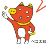
「HAPPY ふくしま隊」のステージ