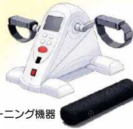
トレーニング機器