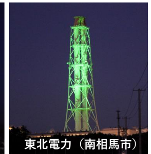
東北電力（南相馬市）