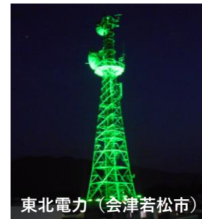
東北電力（会津若松市）