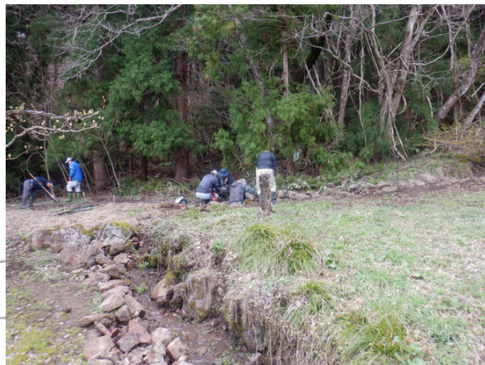
電気柵設置の様子