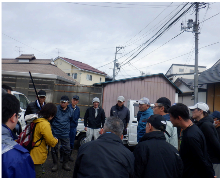
専門家による説明の様子