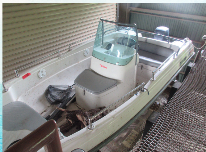
巡回用ボート くまたか丸