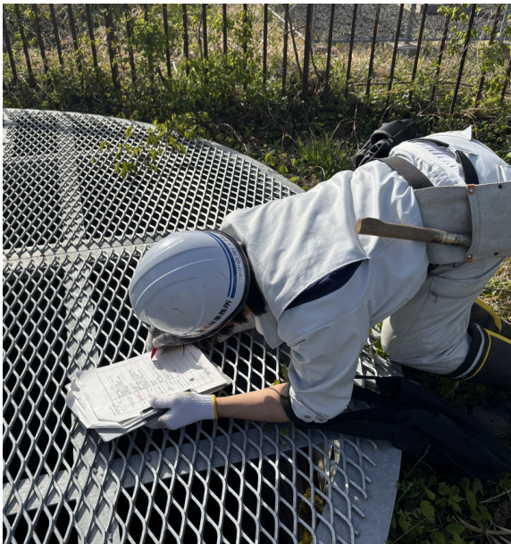
集水井の確認の様子

周辺にお住まいの方で、もし農地のひび割れや、井戸水の濁りなどの異変を発見したときは農林事務所へご連絡ください。