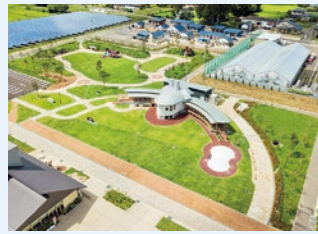
相馬郡飯館村深谷字深谷前 11-1 園 ふかや風の子広場 ☎0244(26)7340