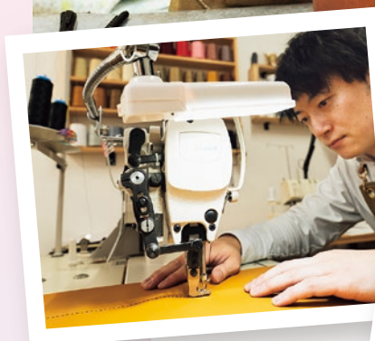
ミシン縫いは丁寧かつスピーディーに。職人技が光ります。